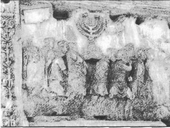
Detalle del Arco de Tito que muestra los tesoros robados del Templo de Jerusalén (el candelabro de los Siete Brazos, la Mano de los Panes de Proposición, los rollos de la Ley y el velo del Santa Sanctorum 3).

y de hambre. Pero los revolucionarios judíos no estaban dispuestos a rendirse y arrojaban por encima de las murallas a aquellos pacifistas que les parecían sospechosos (Guerra de los judíos V, 362).