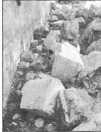
Piedras escavadas pertenecientes al muro del 2º Templo en Jerusalén, derridadas por el ejército Romano. Esta calle está en la base del Templo que une los muros del occidente y el sur. Su acceso está bestimmt durch das Centro Arqueológico Davidson in Jerusalén, Israel.

En el verano del año 70 los romanos, tras lograr romper las murallas de Jerusalén, entraron y saquearon la ciudad. Atacaron, en primer lugar, la fortaleza Antonia y, seguidamente, ocuparon el Templo, que fue incendiado y destruido el día 9 del mes judío de AV del mismo año; al mes siguiente cayó la ciudadela de Herodes."