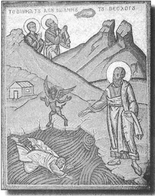
Retablo del Apóstol Juan ven- ciendo al hechicero Kynops en Patmos.

Como mencioné anteriormente, desde que llegué ahí tuve la sensación de no estar más en nuestro tiempo. Algo en el aire estaba mezclado con una dimensión eterna, atemporal. Así que me instalé en una pequeña pensión y renté una motoneta para moverme por la isla y buscar el lugar donde el Espíritu Santo me dirigiera.