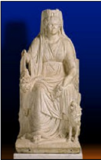
Die Göttin Cybele

Der Kult der Kybele soll in Kleinasien, in der Nähe von Pergamon, entstanden sein. Als Gottheit, die sich um die Belange der Frauen kümmert, als Heilerin und als Beschützerin vor Feinden wurde Kybele oft mit Rhea, der Mutter von Zeus und Demeter, in Verbindung gebracht. Kybele ist unter verschiedenen Beinamen bekannt, wie Magna Mater und Mater Deum (deum = deorum, eine synkopierte poetische Form). Ihre Heimat soll der Berg Ida in der Nähe der Stadt Troja gewesen sein. Frühe Darstellungen zeigen sie zunächst als einen Klumpen schwarzen Steins, dann als Erdmutter. Nachdem die Griechen Kleinasien kolonisiert hatten, verbreitete sich der Kult - allerdings nicht ohne Gewalt. Ein Priester der Kybele soll ermordet worden sein, als er versuchte, den Kult in Athen einzuführen. Als die Stadt von einer Seuche heimgesucht wurde, konsultierten die Griechen ein Orakel (wahrscheinlich das in Delphi) und erhielten den Auftrag, einen Tempel für Kybele zu bauen.