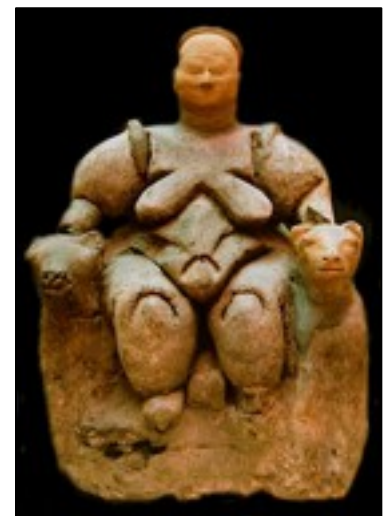
Die berühmte leopardenthronende Göttin aus dem Kornspeicher von Catal Hüyük,

"Auch als Kybele, Magna Mater und Mutter der Götter bekannt, verbreitete sich die Verehrung dieser Göttin im gesamten Römischen Reich. Als phrygische Gottheit war sie eine Göttin der Höhlen, der Erde in ihrem ursprünglichen Zustand; sie wurde auf Berggipfeln verehrt. Sie herrschte über wilde Tiere und war auch eine Bienengöttin. Kybele war die Göttin der Natur und der Fruchtbarkeit. Da Kybele über Berge und Festungen herrschte, hatte ihre Krone die Form einer