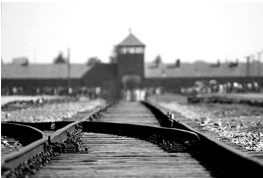
Train track ending at Auschwitz Concentration Camp.

"Für mich geht der Krieg nie vorbei. Ich habe mit eigenen Augen gesehen, wie all diese Kinder mit dem Zug 9 abfahren und wie zwei Nazis die Spielzeugpuppe eines jüdischen Mädchens mitnahmen. Diese Bilder sind für immer auf meiner Netzhaut eingebrannt." ( Interview 2011, nrc übersetzt )