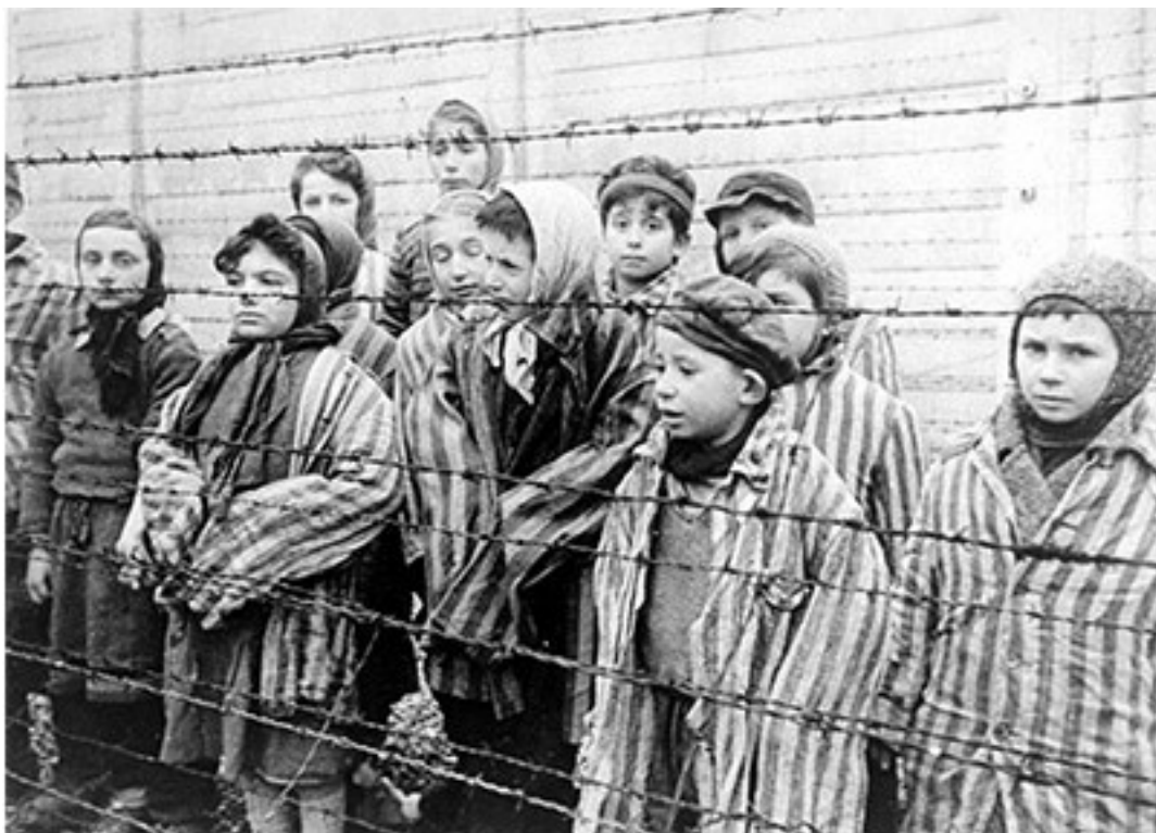
These children were liberated from Auschwitz by the Red Army in January 1945.

Wir sagen: "Wer ein Leben rettet, rettet ein Universum. Du hast Hunderte von Universen gerettet. Ich möchte dir im Namen des jüdischen Volkes, aber auch im Namen der Menschheit danken."