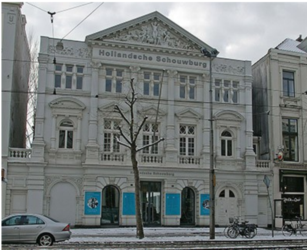
Hollandsche Schouwburg was a luxurious theatre in a vibrant Jewish neighborhood of Amsterdam. Here, 80,000 Jews were collected between 1942–1943 for deportation to death camps. It is now the National Holocaust Memorial of the Netherlands.