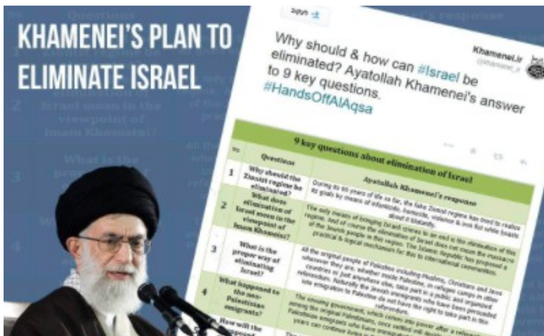
Iran's Supreme Leader, Ayatollah Khamenei published a nine-point plan on Twitter to eliminate Israel, November 4, 2014.

Sie wollten die klaren Pläne zur Ausrottung der Juden in Hitlers Schriften und Reden nicht hören oder glauben. Genauso wie die Menschen heute die vielen islamischen Drohungen nicht hören oder glauben, einschließlich der klaren Pläne des Iran, Atomwaffen auf Israel abzufeuern, um das jüdische Volk zu vernichten.