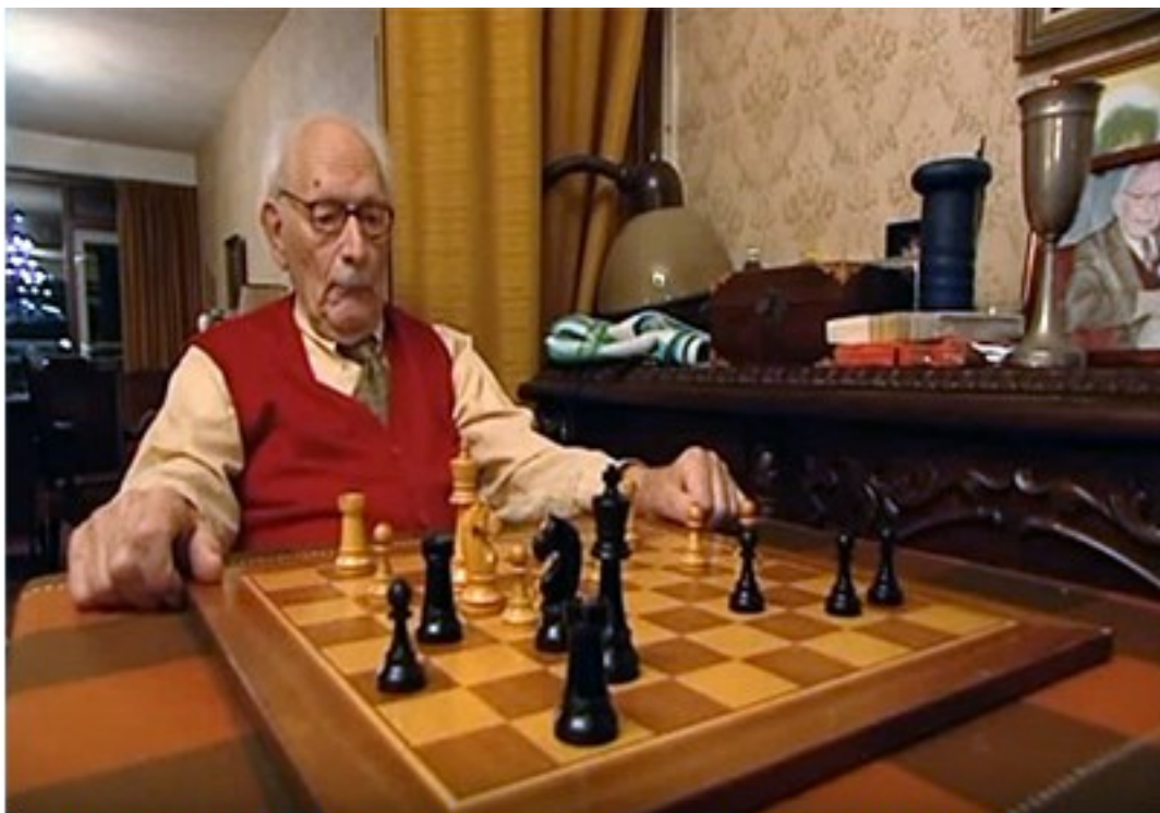
Johan van Hulst was an avid chess player, winning the Corus Chess Tournament for (former) Dutch politicians at the age of 95 and again at 99.